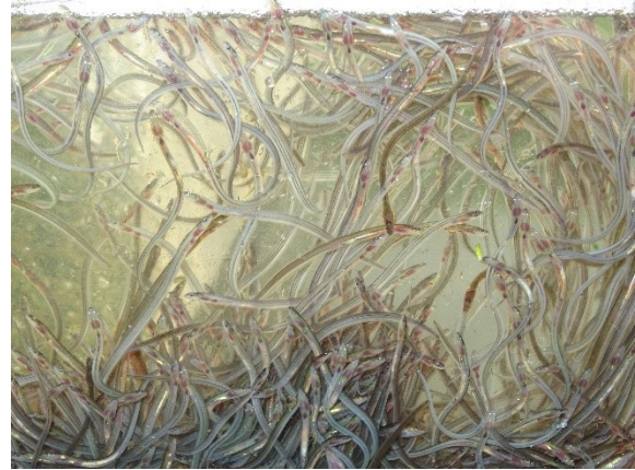
Jaarlijks trekken honderdduizenden glasalen het Noordzeekanaal op, richting omliggende wateren om op te groeien. (foto: M. Melchers).

West-Nederland ligt grotendeels onder de zeespiegel. Hierdoor zijn tal van gemalen, dammen en schutsluizen nodig om het peil te reguleren en het gebied veilig te houden. Voor trekvisseren die van oudsher onze polderwateren opzoeken om op te groeien, zoals de aal, of zich voort te planten, zoals de driedoornige stekelbaars of de houting, levert dit grote problemen op. Gemalen schrikken vis af, en sommige zijn schadelijk. Schutsluizen zijn lastig te passeren door scheepsrumoer en het ontbreken van een lokstroom. Dit zijn problemen waar ook andere vissoorten, zoals baars, snoekbaars en brasem mee te maken hebben. Deze soorten willen optimaal gebruik maken van de verschillende leefgebieden.