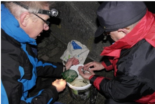
Monitoring van glasaal door vrijwilligers bij Gemaal Overtoom.

De recente realisatie van Zeesluis IJmuiden en de hieraan verbonden maatregel om het extra zout weer uit te spoelen ( Selectieve Onttrekking ) vormen nieuwe uitdagingen voor trekvissen op de overgang tussen zee en Noordzeekanaal. Ook hebben inmiddels optimalisaties plaatsgevonden bij vispassages, en is lokaal het maal- of schutbeheer mede ingesteld op de passage van (trek)vis. De komende jaren wordt de monitoring van trekvispopulaties in het Noordzeekanaal en ommelanden voortgezet om de effecten van de maatregelen in beeld te brengen.