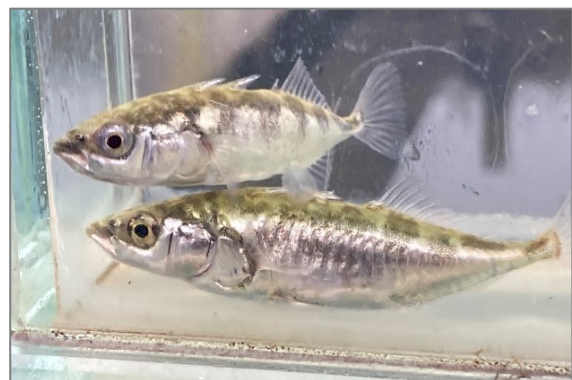
Driedoornige stekelbaars, naast aal een belangrijke trekvis voor onze regio.

Aansluiting zal worden gezocht bij biodiversiteitsprogramma's van de waterschappen en bij de inrichting van Natuur Netwerk Nederland, blauw-groene netwerken en waterberging. Met het beter bereikbaar worden voor trekvissen van opgroei- en voortplantingsgebieden wordt de komende jaren meer onderzoek gedaan naar de inrichting en het beheer van deze leefgebieden. Door hun grote aantallen en hoge voedselkwaliteit vormen trekvissen van oudsher een onmisbare schakel in ecosystemen, bijvoorbeeld als voedsel voor lepelaars en reigerachtigen.